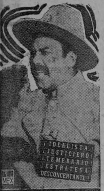
"VIVA PANCHO VILLA" "VIVA LA REVOLUCION"

UNA JOYA DE ORO DE MEXICO. "UNA JOYA DE ORO PARA AMERICA"