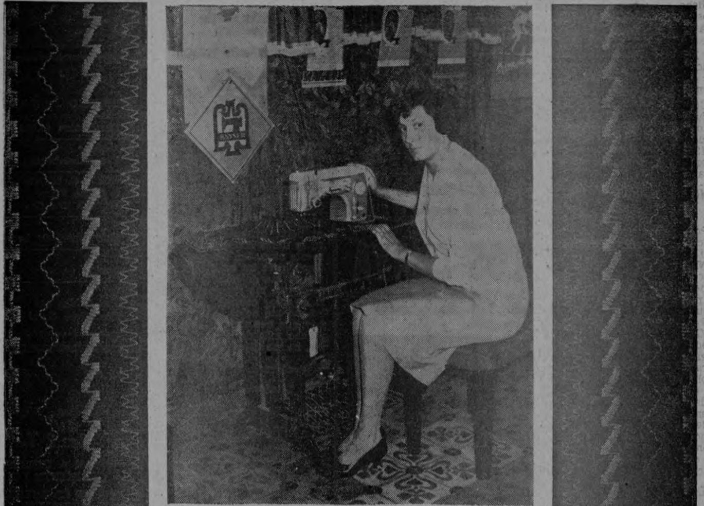
Atentos servidores y amigos:

Estas demostraciones comenzarán a las 9 de la mañana.