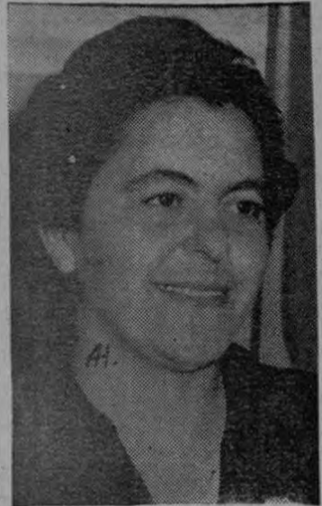
Ministra Estela Quesada

La Ministra Estela Quesada defendió sus actuaciones en la Cámara.— Sobre Ley de Personal Docente del Magisterio, dijo que "no era de su agrado". — Sacerdotes y estudiantes católicos en las barras.—